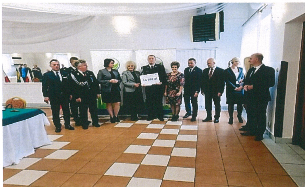
Jednostka OSP Stodzew