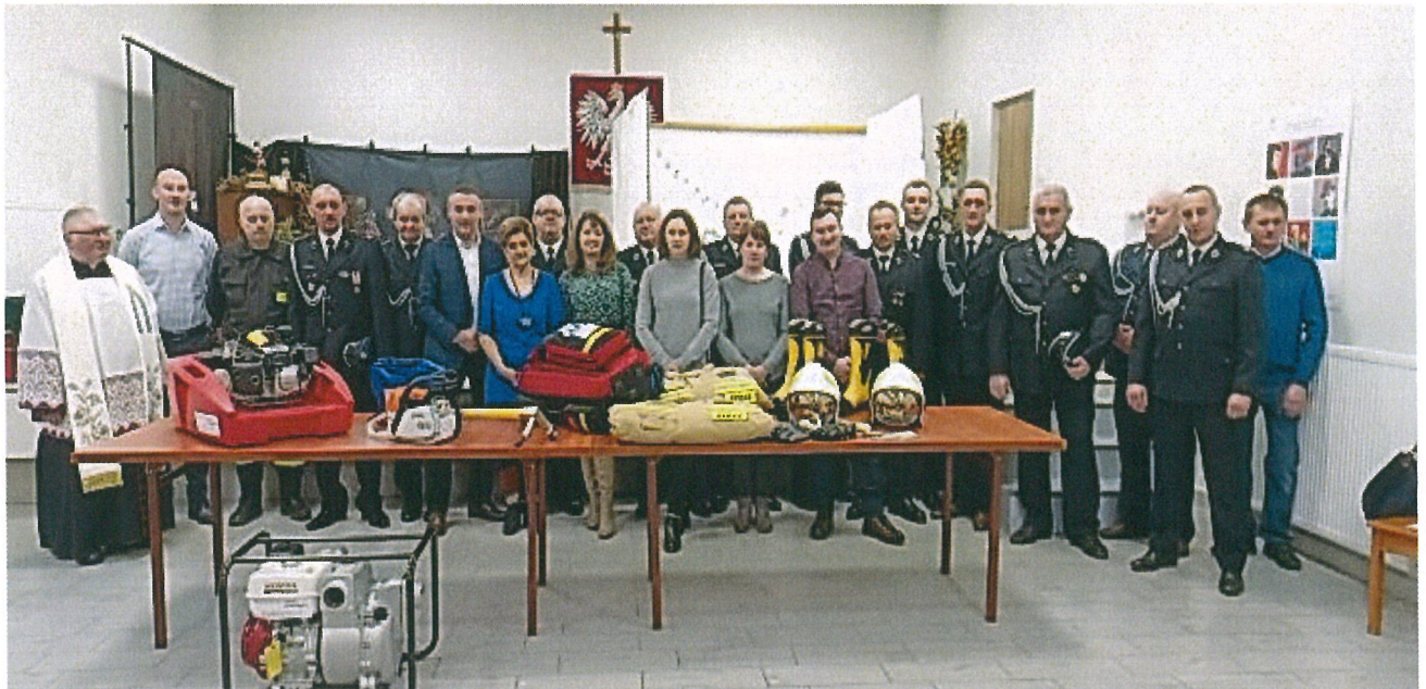
Sprzęt ratowniczo-gaśniczy dla jednostek OSP