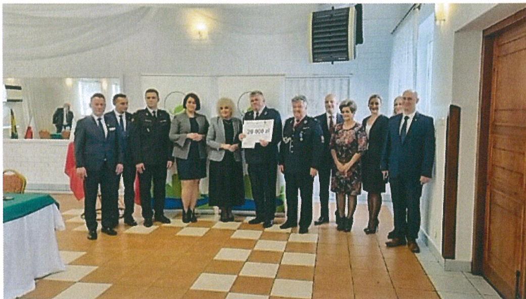
Jednostka OSP Starowola