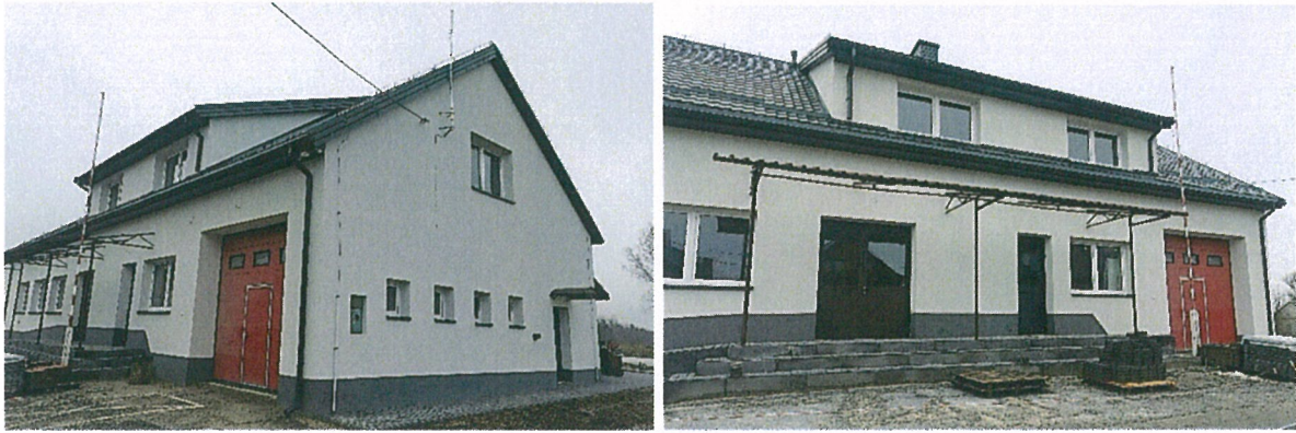
Remont remizo - świetlicy OSP Starowola

Drugie dofinansowanie w kwocie 6 004 tys. zł gmina otrzymała na zadanie pod nazwą Modernizacja infrastruktury drogowej na terenie Gminy Parysów. W obecnej chwili trwają przygotowania do ogłoszenia postępowania przetargowego. Kolejne środki jakie gmina otrzymała z budżetu państwa to środki finansowe w kwocie 1 660 tys. zł na uzupełnienie subwencji ogólnej, z przeznaczeniem na wsparcie finansowe inwestycji w zakresie kanalizacji. Realizacja zadania zaplanowana jest do wykonania w bieżącym roku.