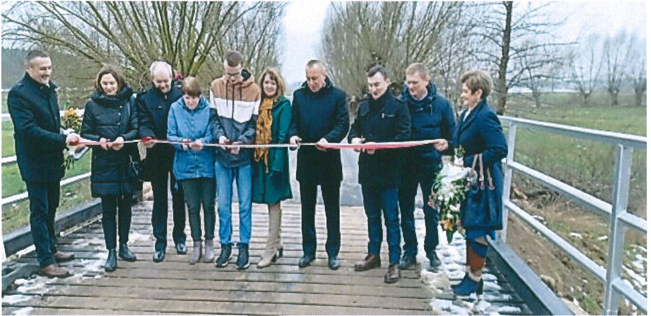
Remont mostu w miejscowości Kozłów