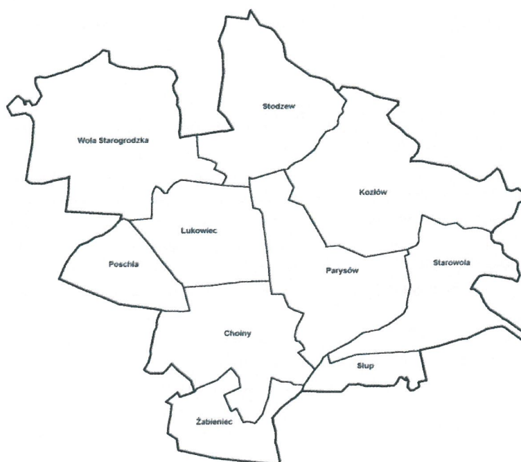
Podział Gminy Parysów na sołectwa