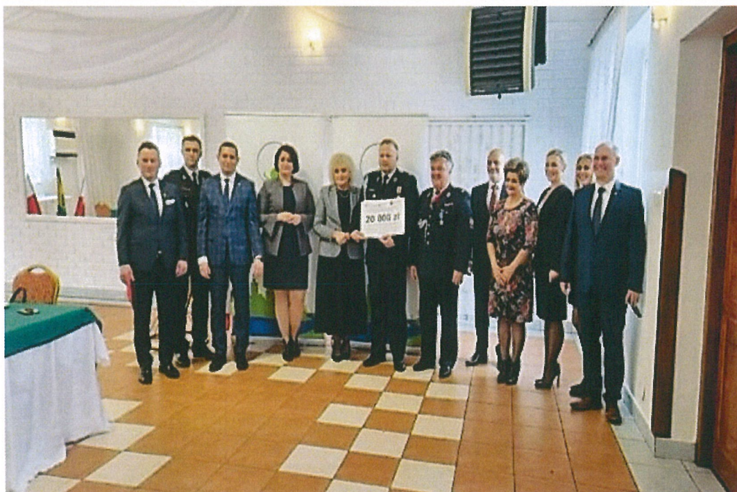
Jednostka OSP Wola Starogrodzka

Dofinansowanie w kwocie 12 361 zł dostała jednostka OSP Parysów, w kwocie 20 000 zł otrzymała OSP Starowola, w kwocie 20 000 zł OSP Wola Starogrodzka, w kwocie 14 662 zł OSP Stodzew pochodzi do Wojewódzkiego Funduszu Ochrony Środowiska i Gospodarki Wodnej w Warszawie