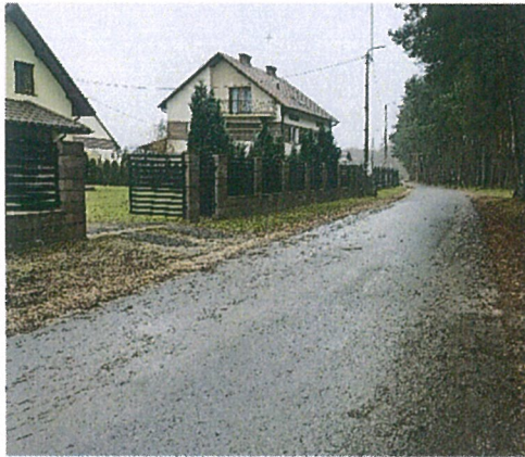
Droga gminna przy PKP Parysów

W pierwszej edycji w ramach programu „Polski Ład” gmina otrzymała kwotę 4 940 tyś. zł na realizację zadania pod nazwą modernizacji dróg gminnych na terenie Gminy Parysów w miejscowościach: Kozłów, Łukówiec, Wola Starogrodzka i Żabieniec.