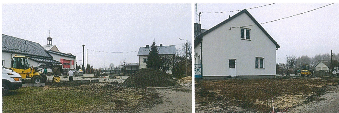
Remont remizo - świetlicy OSP Wola Starogrodzka

W drugiej edycji w ramach programu „Polski Ład” gmina otrzymała dwa dofinansowania. Pierwsze dofinansowanie w kwocie 3 300 tyś. zł na realizację zadania pod nazwą Modernizacja remizo-świetlic na terenie Gminy Parysów wraz z ich otoczeniem. Inwestycja jest w trakcie realizacji. Planowane zakończenie robót przewidziane jest na 30 czerwca 2023 r.