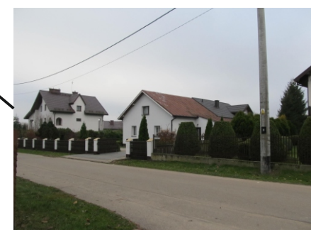
Zabudowa mieszkaniowa jednorodzinna w sąsiedztwie