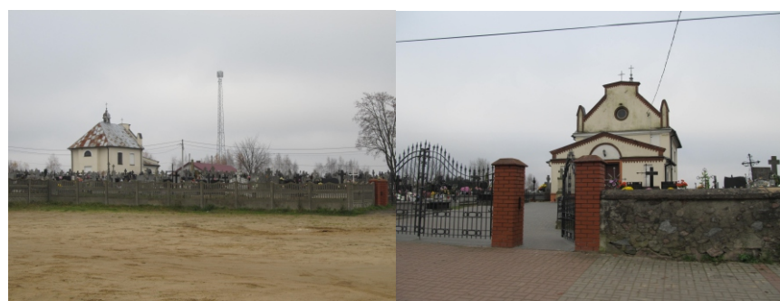
Cmentarz wraz z kaplicą