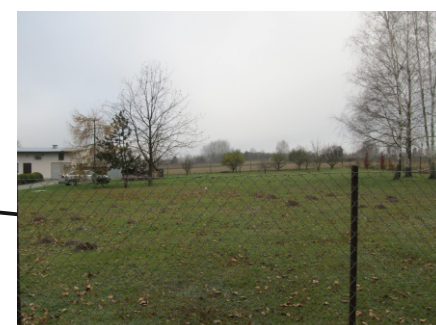
Zieleń urządzona towarzysząca zabudowie