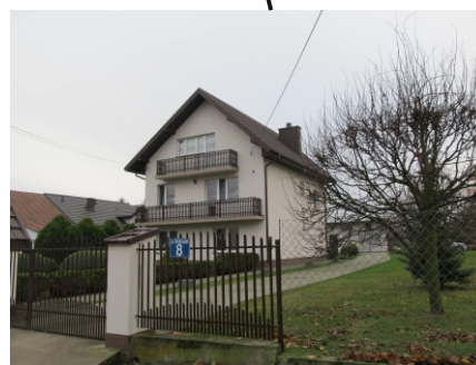
Zabudowa mieszkaniowa jednorodzinna na terenie opracowania