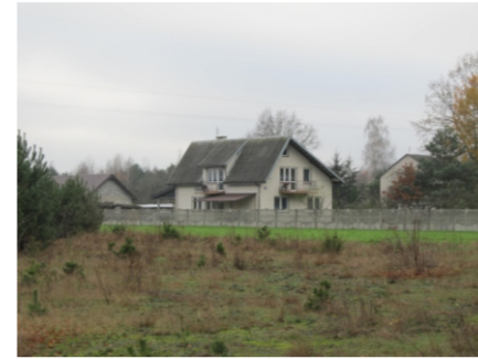
Zabudowa mieszkaniowa na terenie opracowania