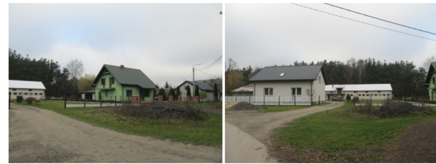
Zabudowa mieszkaniowa w sąsiedztwie