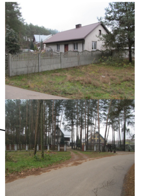
Istniejąca zabudowa oraz teren lasu