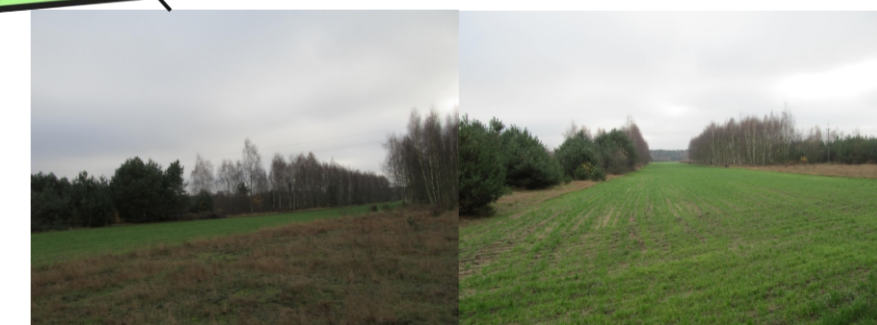
Tereny rolne oraz enklawy zieleni wysokiej