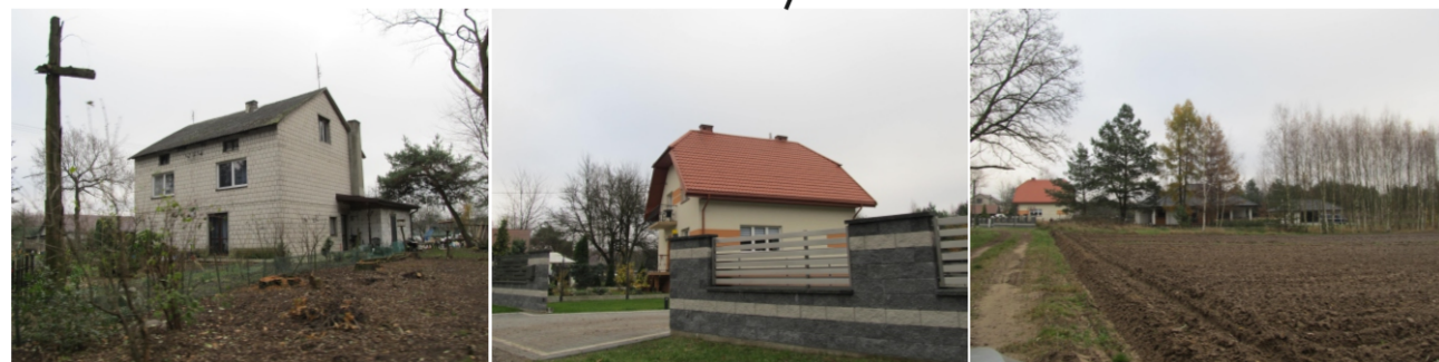
Zabudowa mieszkaniowa na terenie opracowania